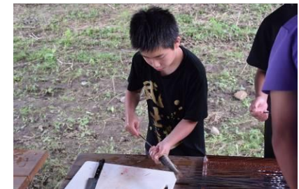
イワナを食べよう！