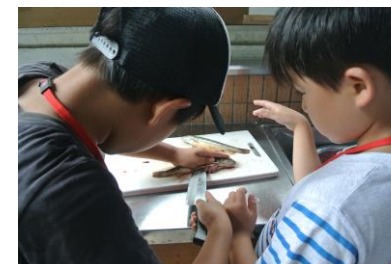
イワナを食べよう！