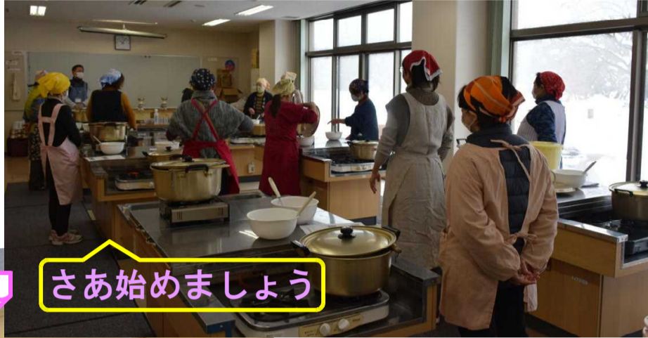
さあ始めましょう