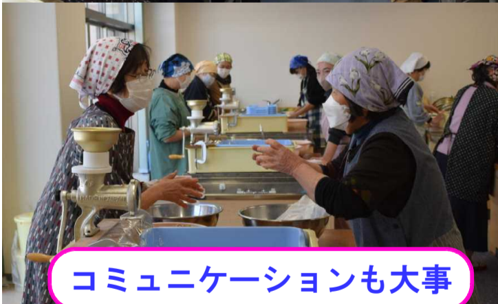
コミュニケーションも大事