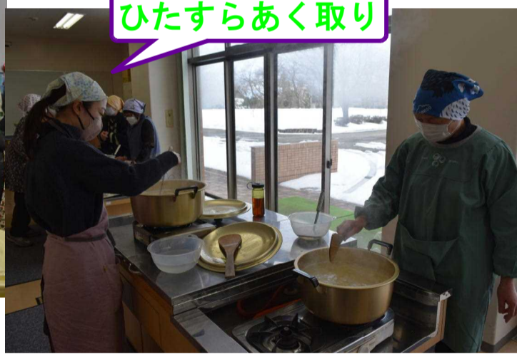
ひたすらあく取り