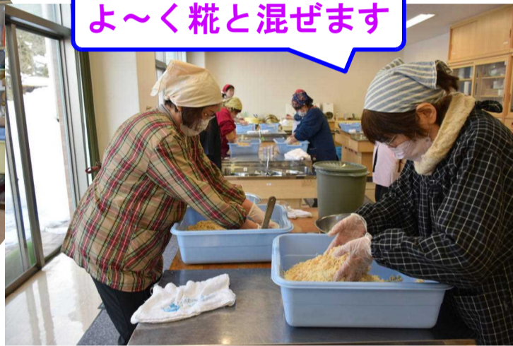
よ〜く糀と混ぜます