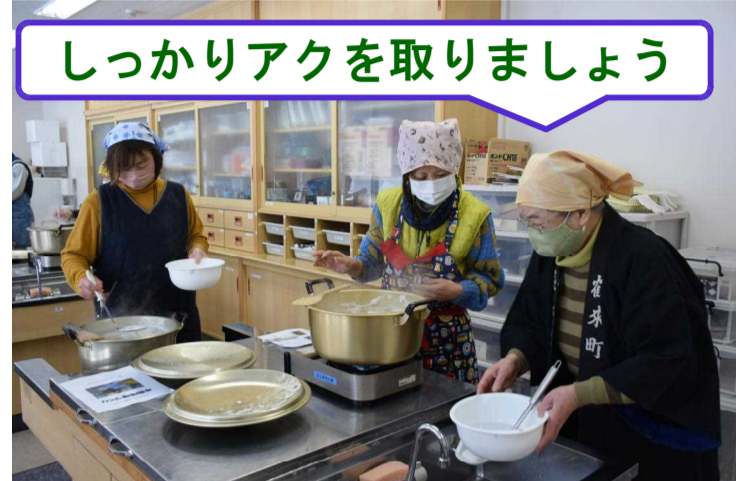
しっかりアクを取りましょう