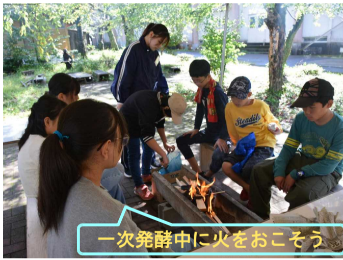
一次発酵中に火をおこそう