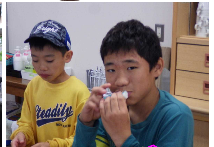
シメは昨日作ったほうらい寿司!