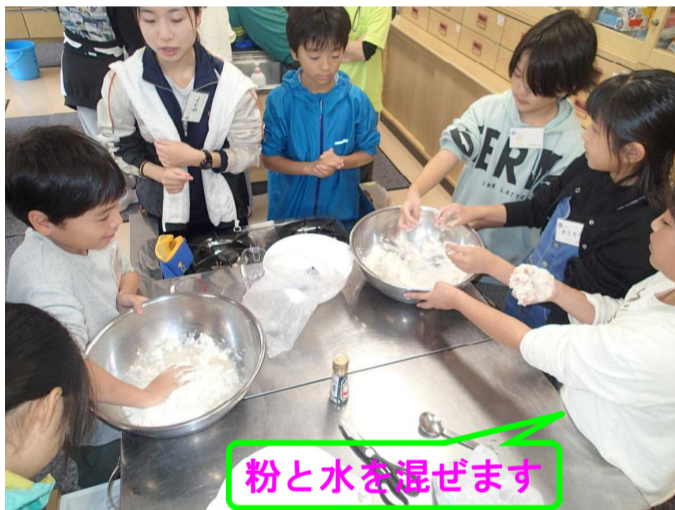
粉と水を混ぜます