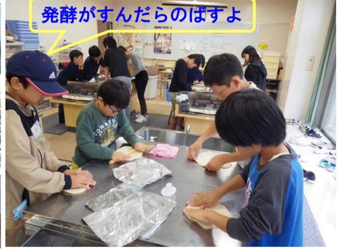
発酵がすんだらのはずよ