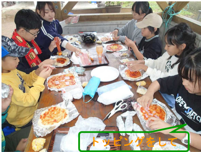
トッピングをして