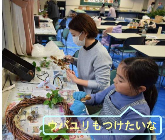
ウバユリもつけたいな