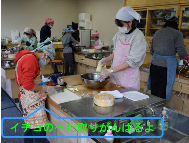
イチゴのへた取りがんばるよ