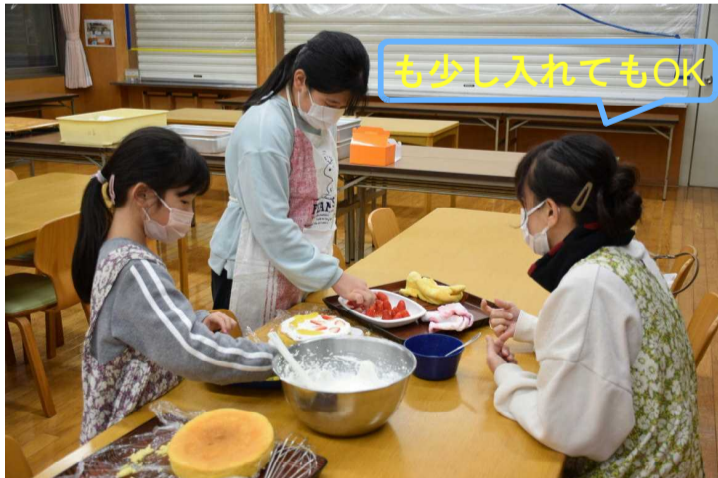
もう少し入れてもOK