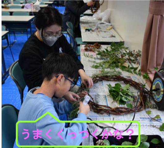
うまくくっつくかな？