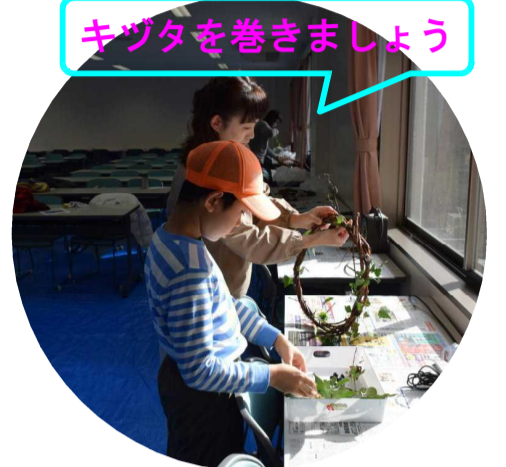
キヅタを巻きましょう