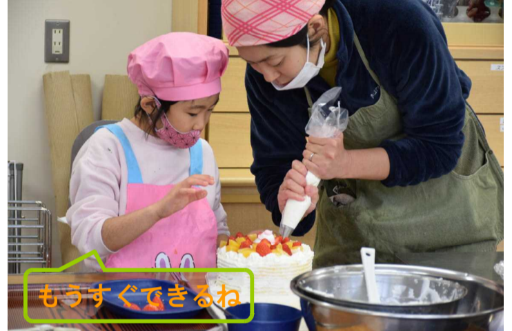
もうすぐできるね