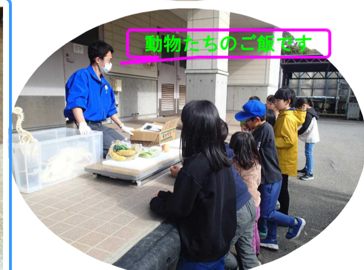
動物たちのご飯です