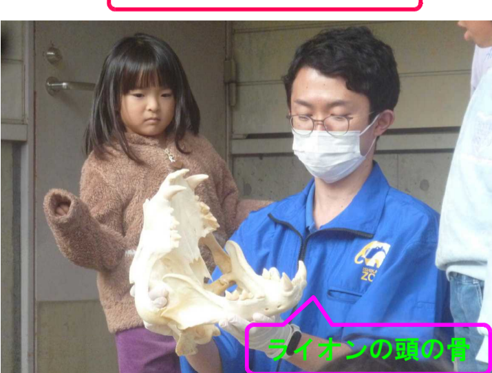
ライオンの頭の骨