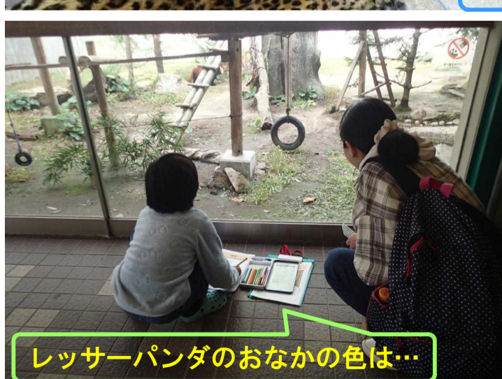
レッサーパンダのおなかの色は...