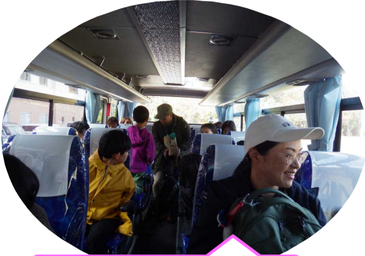
バスに乗って動物園に出発!