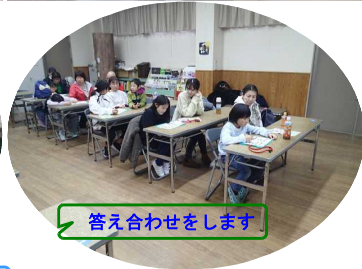
答え合わせをします