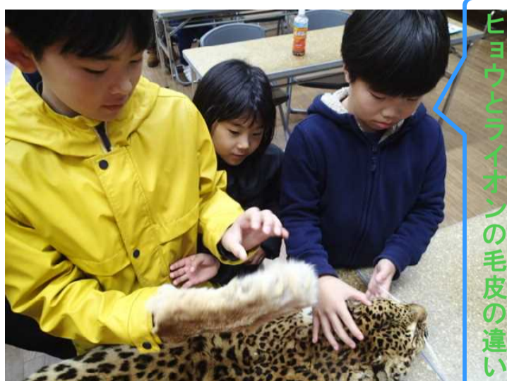
ヒョウとライオンの毛皮の違い