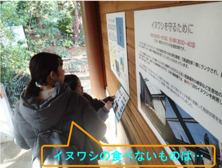
イヌワシの食べないものは...