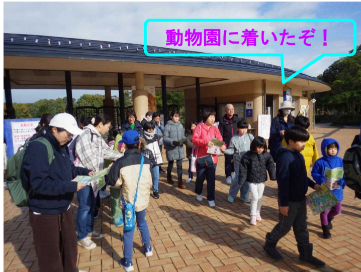
動物園に着いたぞ!