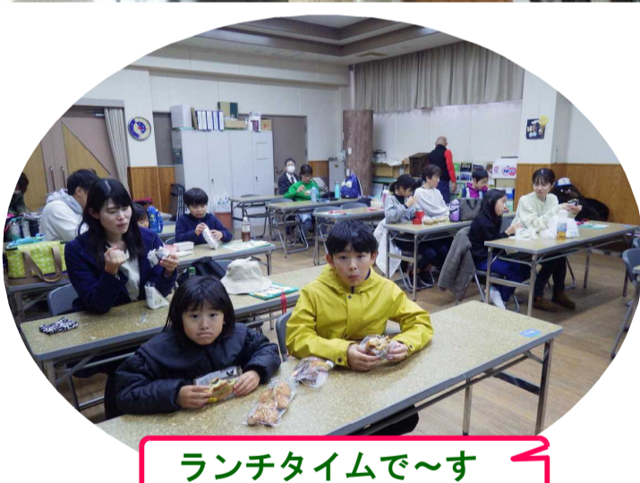
ランチタイムで～す