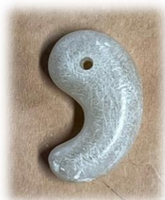
全体が丸くなったら表面を 滑らかに仕上げる