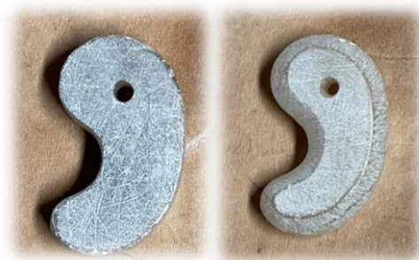
角をおとして、丸くなるようにけずる