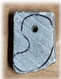
キリで穴を開け 決めた形にそってけずる