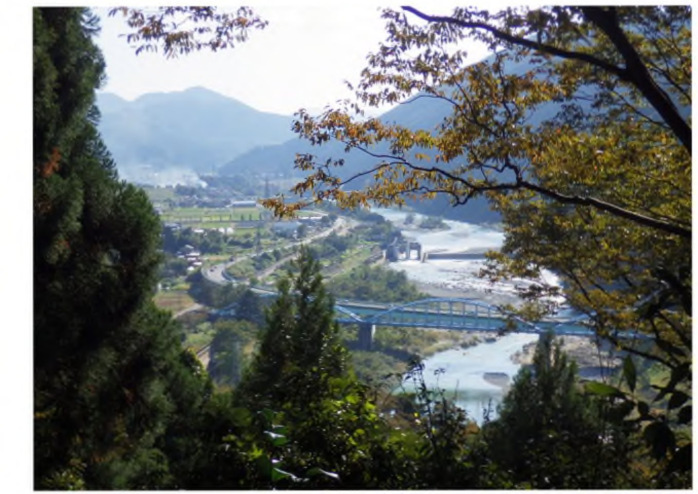
展望台からの景色