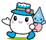
ゆきママとしずくちゃん

手取川水系にあたる直海谷川で水中生物観察・イワナつかみ、そして白山青年の家でのテント泊に、親子でチャレンジしましょう!