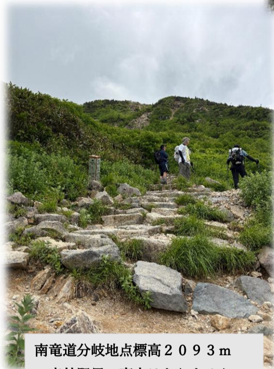
南竜道分岐地点標高2093m 森林限界、高木はありません