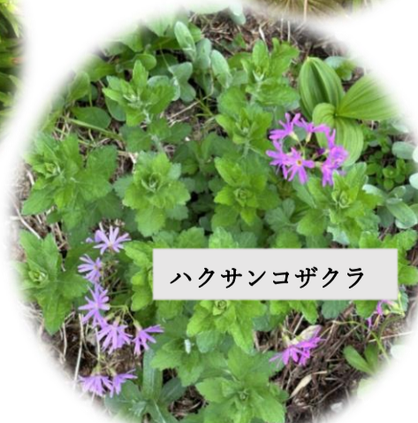
ハクサンコザクラ