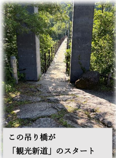
この吊り橋が「観光新道」のスタート