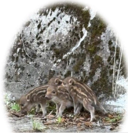
市ノ瀬の手前(車道)でうりぼう5匹に出会いました。母イノシシは走り去り、チビちゃん達は困り顔・・・