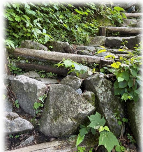
スタート15分、がんばりどころの石段