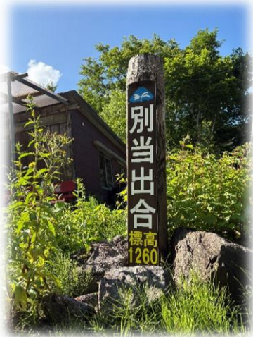
別当出合登山口 標高1260m