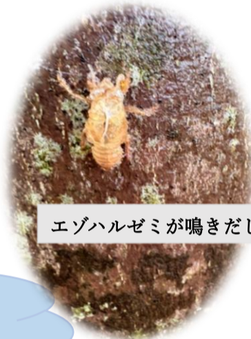
エゾハルゼミが鳴きだしました