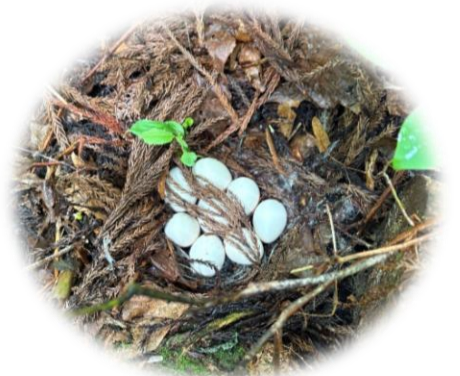
「ヤマドリ?」の巣に卵が8個