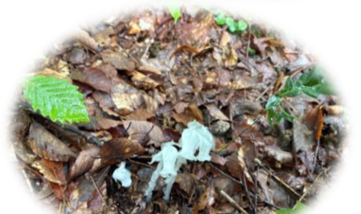
全身真っ白 「ギンリョウソウ」