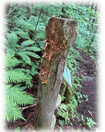
ペンキがぬられた木をかじったのはだれだ!?